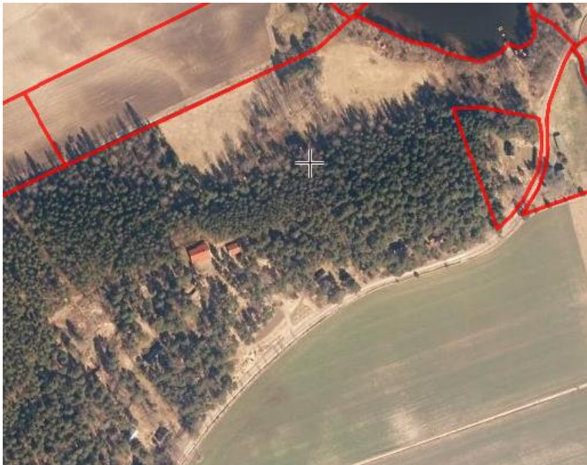
Ovanmalmträsketin eteläkärjen alueesta ilmakekuva otettuna ennen lehtien puhkeamista.