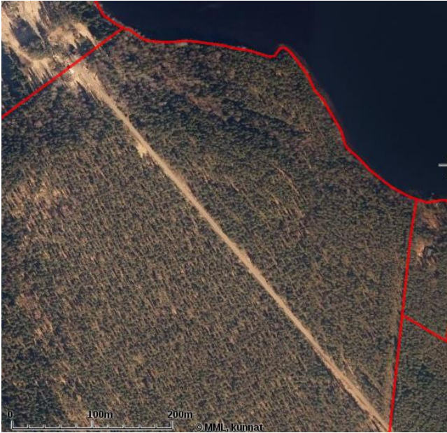
Kullsjön alueen ilmakekuva.

Pellarholmenin eteläpuolisella ranta-alueella on sauna. Ovanmalmträsketin eteläkärjen ranta-alueella on rakennettuna 3 asuinrakennusta talousrakennuksineen. Näillä ei ole välitöntä yhteyttä rantaan vaan ovat osa Fastarby Gårdin muodostamaa kyläaluetta. Edellä mainitun saunan ja asuinrakennusten lähialuetta lukuun ottamatta rannat sisältyvät maatilan metsätaloustoimintaan ja ovat luonteeltaan talousmetsää.