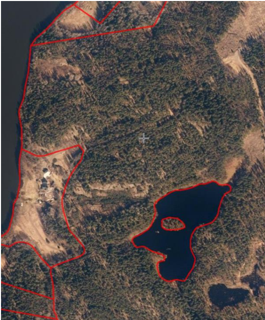
Ovanmalmträsketin ja Kvarnträsketin pohjoisin alue ilmakekuvattuna.