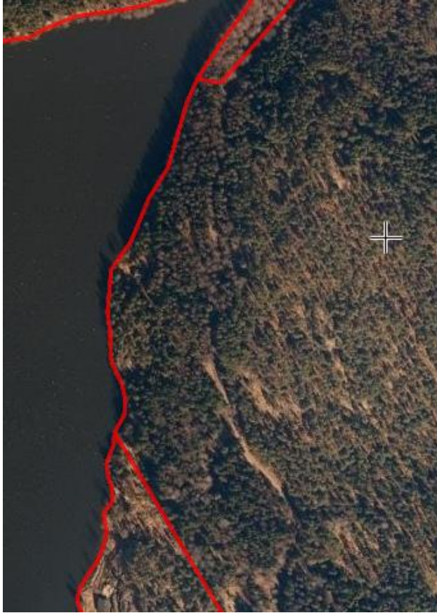
Ovanmalmträsketin keskialueesta ilmakekuva.