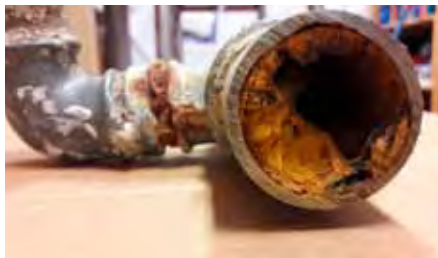
Över 50 år gamla vattenledningar kan nästan växa igen och försvaga vattnets kvalitet.

Ansvarsgränsen mellan fastigheten och vattentjänstverket är stamvattenledningen vad gäller vattenledningsnätet. I fråga om spill- och dagvatten-nätet är gränsen huvudavloppet eller anslutningsbrunnen. Fastigheten ansvarar också för en eventuell uppdrämningsventil i källaren eller ett pumpverk. Om det svämmer över avloppsvatten nedanför uppdrämningshöjden, svarar fastigheten själv för skadorna.