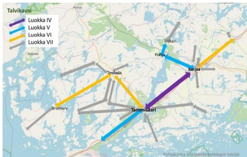
Kuva 1: Viranomaisalue ja värillisenä runkoreitistö