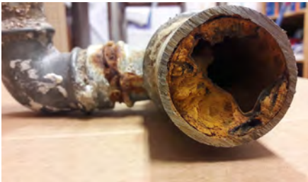
Yli 50 vuotta vanhat vesijohdot voivat kasvaa lähes umpeen ja heikentää veden laatua.

Kiinteistön ja vesihuoltolaitoksen vastuuraaja on vesijohtoverkon osalta runkovesijohdossa. Jätevesi- ja hulevesiverkoston osalta vastuuraaja on runkoviemäriässä tai liitoskaivossa. Myös kellaritilojen padotusventtiili tai pumppaamo on kiinteistön vastuulla. Jos padotuskorkeuden alapuolisiin tiloihin tulvii viemäriävesiä, tulvasta aiheutuneet vahingot ovat kiinteistön omalla vastuulla.